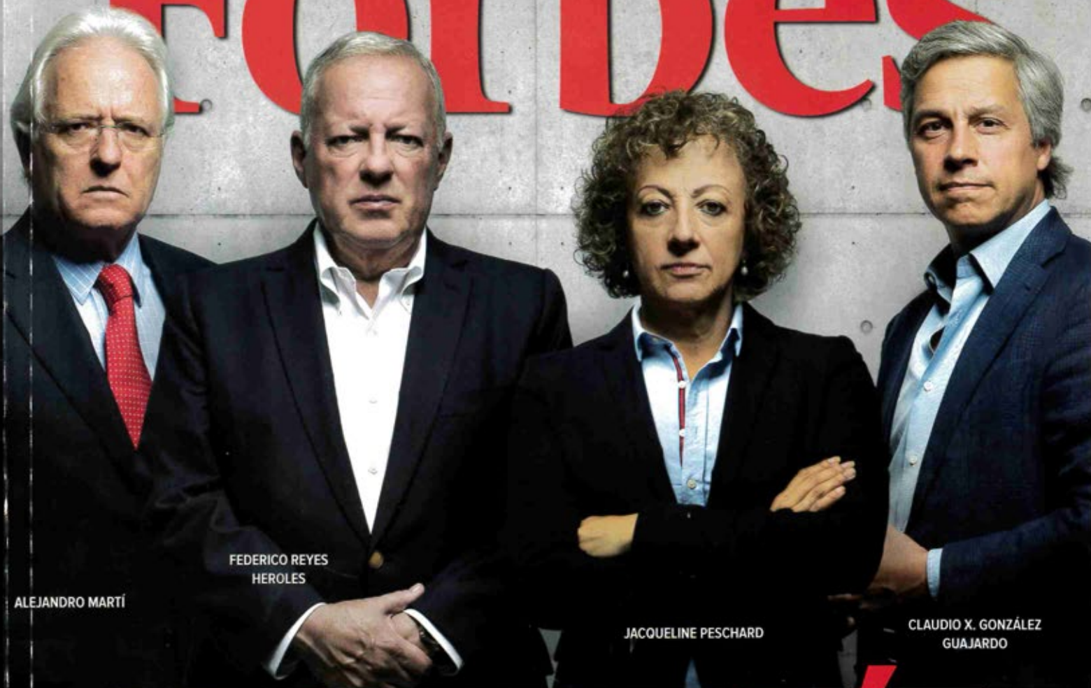
FEDERICO REYES HERÓLES